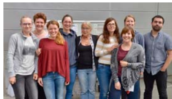
Das Team hinter der ESU

Hauptlogo der Europäischen Sommeruniversität in Digitalen Geisteswissenschaften „Kulturen und Technologien“